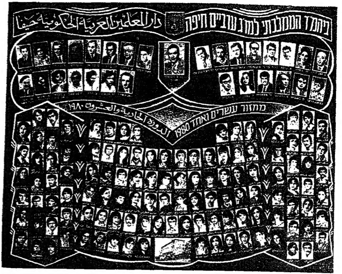
حيفا - من شقيق منصور - احتفل في دار المعلمين والعلميين العربية في حيفا أمس بتوزيع الشهادات على خريجي الفوج الحادي والعشرين من طلاب وطالبات الـ 118 طالبا وطالبة من أهوا سنتين دراسيتين و 40 طالبا وطالبة من أهوا ثلاث سنوات دراسية وحصلوا على شهادة معلم مؤهل كبير .

من خريجي الفوج الحادي والعشرين في دار المعلمين العربية بحيفا